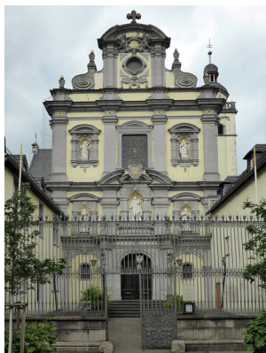
Das Kölner Karmel

Eintritt in den Kölner Karmel als Postulantin