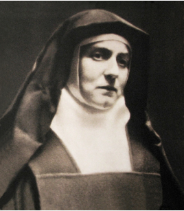
Edith Stein

Edith Stein ist eine der großen Frauengestalten der Kirche des 20. Jahrhunderts.